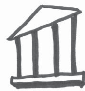
Tribunales de Circuito