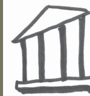
Tribunal de Apelaciones

Maryland Judiciary Office of Communications and Public Affairs 2009-D Commerce Park Dr. Annapolis, MD 21401 Tel: 410-260-1488